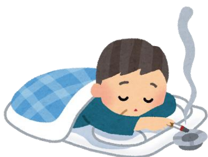
【寝たばこ等による火災】