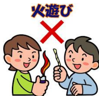
【火遊びによる火災】