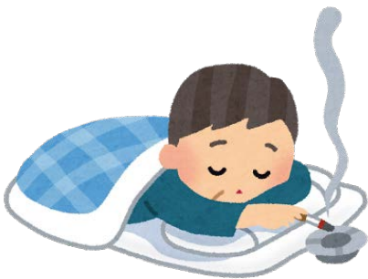
【寝たばこ等による火災】