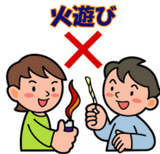
【火遊びによる火災】